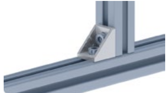
Winkel 20 Connection Angle 20