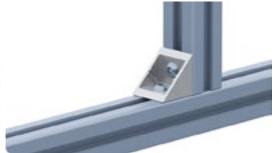
Winkel 40 flach Connection Angle 40 Flat