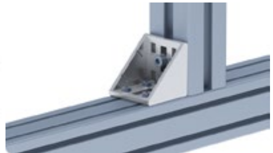
Winkel 60 Connection Angle 60