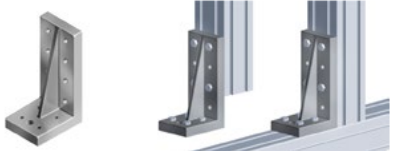
Versteifungswinkel 80 x 180 Support bracket 80 x 180