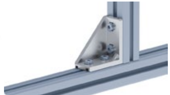
Aluwinkel 20/40 Alu Connection Angle 20/40