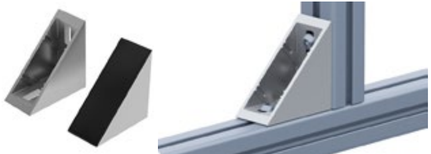
Winkel 40/80 flach Connection Angle 40/80 Flat