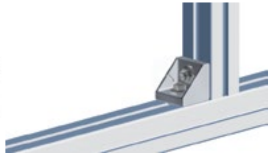
Aluwinkel 43 x 42 Alu Connection Angle 43 x 42