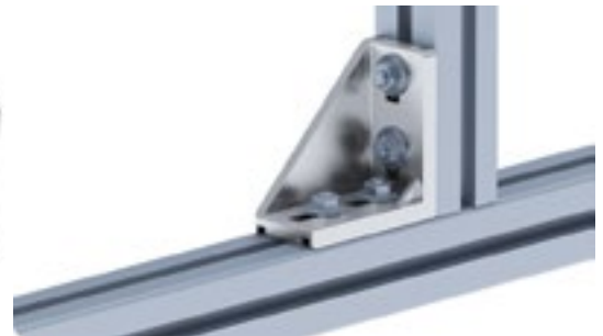
Aluwinkel 45/90 Alu Connection Angle 45/90