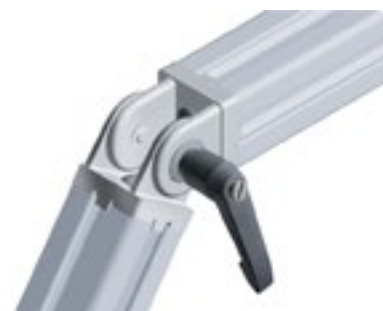
Gelenk 30 mit Klemmhebel Pivot Joint 30 with Locking Lever