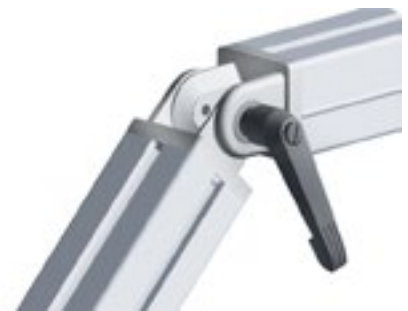
Gelenk 45 mit Klemmhebel Pivot Joint 45 with Locking Lever