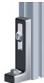
Bodenwinkel 160 Floor Bracket 160