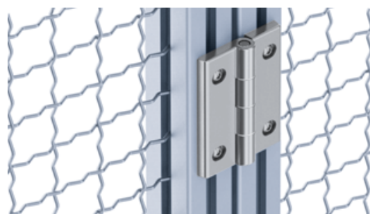
Schwerlastscharnier Heavy-duty Hinge