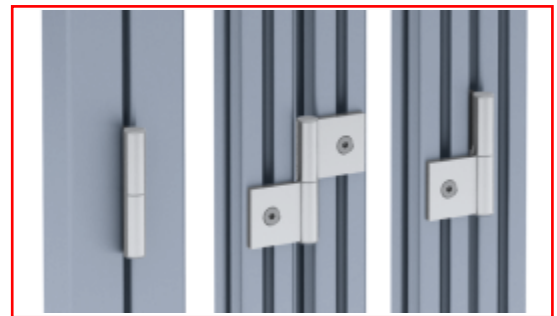
Aluminium-Scharnier 40 leicht Aluminum Hinge 40 Light