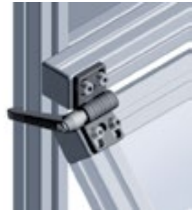
Zinkdruckguss-Scharnier Die-cast Zinc Hinge