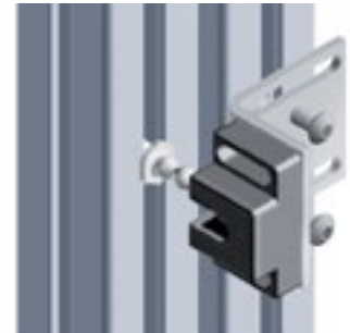
Befestigungswinkel für Kugelschnäpper Angle Bracket for Ball Catch