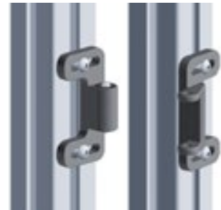
Doppelkugelschnäpper PA Double Ball Catch PA