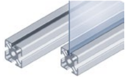
Abdeck- und Einfassprofil Cover and Reduction Profile