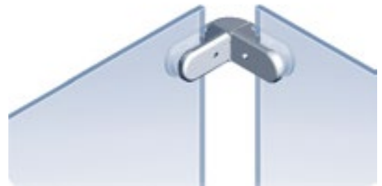
Eckverbinder für Glasscheibenhalter Corner Connection for Glass Panel Clamp